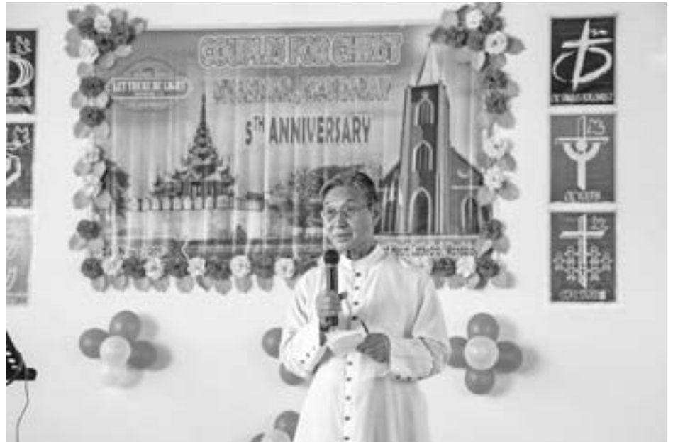
မူပေးသည်ဟုလည်းသိရှိရပါသည်။

CFC သည် မိသားစုများအားပိ ညာဉ်ရေးရာ၌ ရှင်သန်တိုးတက်ပြီး ဘာသာ တရား ကိုင်းရှိုင်းသော၊ ကိုယ်ကျင့်တရား