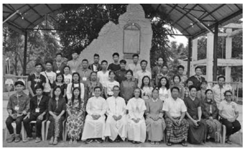
OSC - BANMAW

ယင်းသင်တန်းတွင် တိုက်နယ်အသီးသီးမှလူငယ်စုစုပေါင်း (၄၀) ဦးခန့် တက်ရောက်ခဲ့ပါသည်။