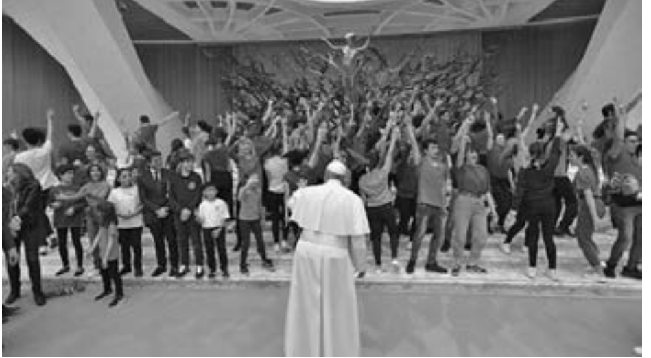
ကျောင်းသားကျောင်းသူများအားလည်း "ငါတတ်နိုင်သည်" ထက် "ငါတို့အားလုံးအတူ တတ်နိုင်သည်" ဟု ဆောင်ပုဒ်ကို ဆိုကြရန် တိုက်တွန်းခဲ့သည်။ "အတူတူဆိုရင် ပိုပြီး လှပတယ် ပိုပြီး ထိရောက်ပါတယ်" ဟု မိန့်မှာခဲ့သည်။

"ကမ္ဘာရွာကြီး၏ ပညာရေး" အသွင်ဖြင့် ကျောင်းသား ကျောင်းသူများအား သွန်သင်ခြင်းဖြင့် လူအများအကြား သဟဇာတဖြစ်ရေး၊ ငြိမ်းချမ်းစွာ အတူတကွ နေထိုင်တတ်ရေး တို့ကိုသွန်သင်ကြရမည် ဖြစ်သည်။ ဤနည်းဖြင့် အကြမ်းဖက်မှုများ၊ ခွဲခြားဆက်ဆံရေးများနှင့် အနိုင်ကျင့်မှုများကို ဖယ်ရှားနိုင်မည်ဖြစ်သည်။