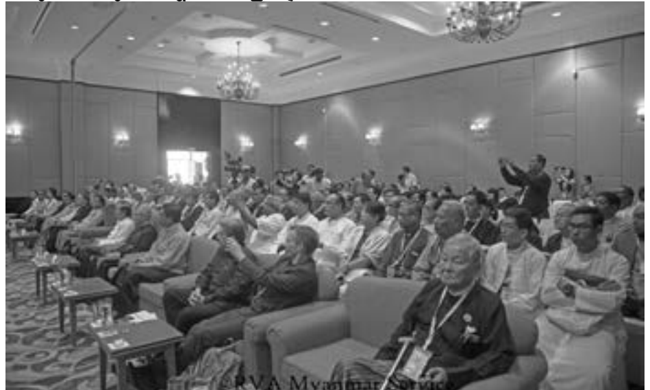
Pinky ( MDY-OSC)

ကမ္ဘာ့ ကုလသမဂ္ဂ အပြည်ပြည် ဆိုင်ရာ နားလည်သင့်မြတ်မှုနေ့ကို ၁၉၉၅ ခုနှစ်တွင် ကုလသမဂ္ဂ အထွေထွေညီလာခံ ကြီးက သတ်မှတ်ခဲ့ပြီး နှစ်စဉ်ဒီဇင်ဘာလ (၁၆) ရက်နေ့တွင် ကျင်းပပါသည်။ မြန်မာ နိုင်ငံအနေဖြင့် ယခုအကြိမ်သည် ပထမဦး ဆုံးအကြိမ်ကျင်းပခြင်းဖြစ်ပါသည်။