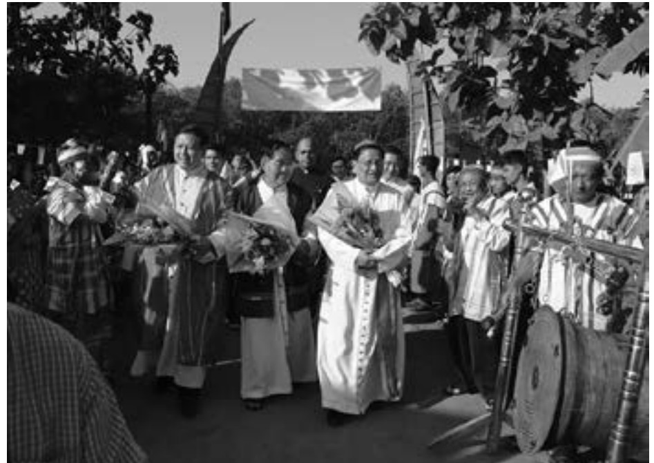
မြန်မာနိုင်ငံကက်သလစ်ဆရာတော်ကြီးများအဖွဲ့ချုပ် - လူထုဆက်သွယ်ရေးရုံး