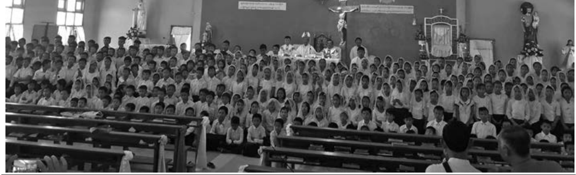
မြန်မာနိုင်ငံကက်သလစ်ဆရာတော်ကြီးများအဖွဲ့ချုပ် - လူထုဆက်သွယ်ရေးရုံး