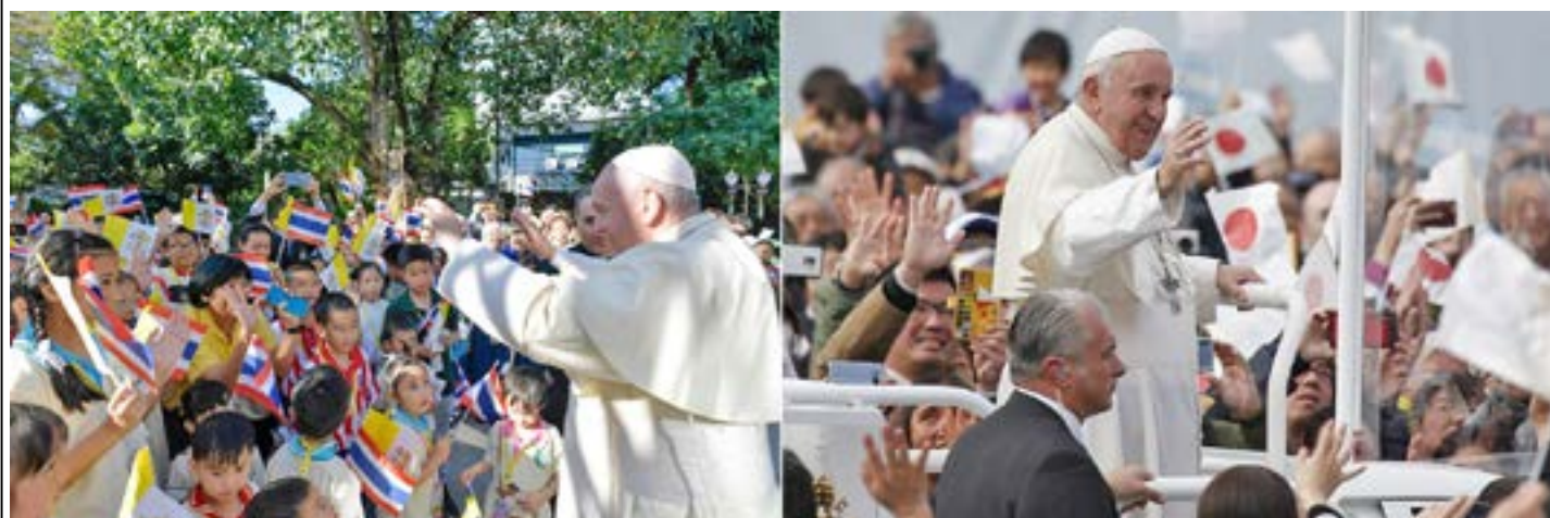
ပုပ်ရဟန်းမင်းကြီး ဖရန်စစ်၏ ထိုင်း နှင့် ဂျပန် ခရီးစဉ်