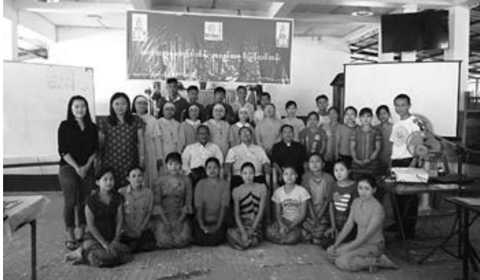
ကက်သလစ် ဘော်ဒါထိန်းအရည် အချင်းမြှင့် အသိပေးသင်တန်းကို မော်လမြိုင်ဝိုက်အုပ်သာသနာ၊ မြိတ်မြို့ရှိ ကလောင်

ရေပုန်းရပ်ကွက်တွင် အောက်တိုဘာလ ၂၃ ရက်မှ ၂၇ ရက် ၂၀၁၉ ခုနှစ်တွင်ပြုလုပ် ကျင်းပခဲ့ကြသည်။