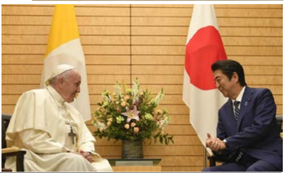
မြန်မာနိုင်ငံကက်သလစ်ဆရာတော်ကြီးများအဖွဲ့ချုပ် - လူထုဆက်သွယ်ရေးရုံး