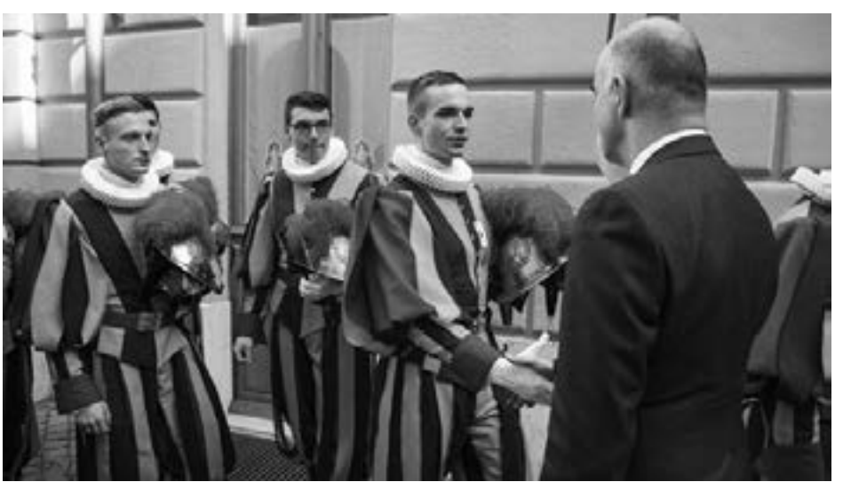
ကြည်စိတ်ချနိုင်တဲ့ မျှော်လင့်ချက်မျိုး ထားရှိနိုင်ပါပြီ” ဟုလည်းဆိုသည်။

“ကျွန်တော်ပြန်ထပြီး ရှေ့ဆက်ဖို့ ခွန်အားနဲ့ ကျေးဇူးကို အမြဲရရှိခဲ့ပါတယ်။ ကျွန် တော့ယုံကြည်ခြင်းတွေ အများကြီးခိုင်မာလာခဲ့ပါပြီ။ အနာဂတ်မှာလည်းကျွန်တော့ ဘဝမှာ နှစ်မြုပ်မယ့်အခြေအနေတွေကို ရင်ဆိုင်ရရင်တောင်မှ ဘုရားသခင်အပေါ် ယုံ