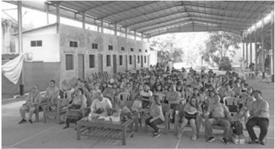
CFC Myanmar, Mandalay ငါး နှစ်ပြည့်အခမ်းအနားသို့ CFC Philippines