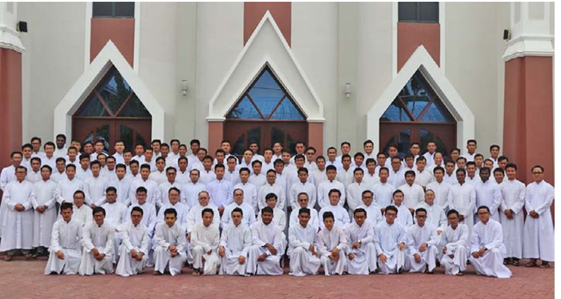
မြန်မာနိုင်ငံကက်သလစ်ဆရာတော်ကြီးများအဖွဲ့ချုပ် - လူထုဆက်သွယ်ရေးရုံး