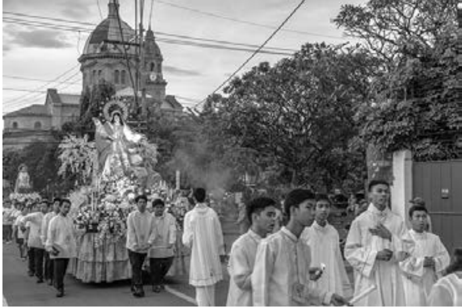
လာပါလိမ့်မယ်။

အခု အာရှအတွင်း ကက်သလစ် ဘာသာဝင်အများဆုံး နေထိုင်တဲ့ ဖိလစ်ပိုင် နိုင်ငံမှာလည်း အဲဒီ စက်တင်ဘာ လ ၈ ရက် နေ့ ကို မယ်တော်မာရီယာအား ဂုဏ်ပြုတဲ့ အနေဖြင့် တနိုင်ငံလုံးဆိုင်ရာ အားလပ်ရက် အဖြစ် သတ်မှတ်ဖို့ ဥပဒေပြု လွှတ်တော်က အတည်ပြုလိုက်ပါပြီ။ နောက် ဆုံးအဆင့် အနေဖြင့် သမ္မတဒုတိယတေးရဲ့ လက်မှတ် ထိုး အတည်ပြုကြေငြာပေးဖို့သာ လိုပါတော့ တယ်။ သမ္မတကြီး လက်မှတ်ထိုး ပေးပြီးရင် တော့ ဒီလို မယ်တော်မာရီယာအား ဂုဏ်ပြု တဲ့ နိုင်ငံလုံးဆိုင်ရာ အားလပ်ရက် ဟာ ဒုတိယမြောက် မာရီယာအားလပ်ရက် ဖြစ်