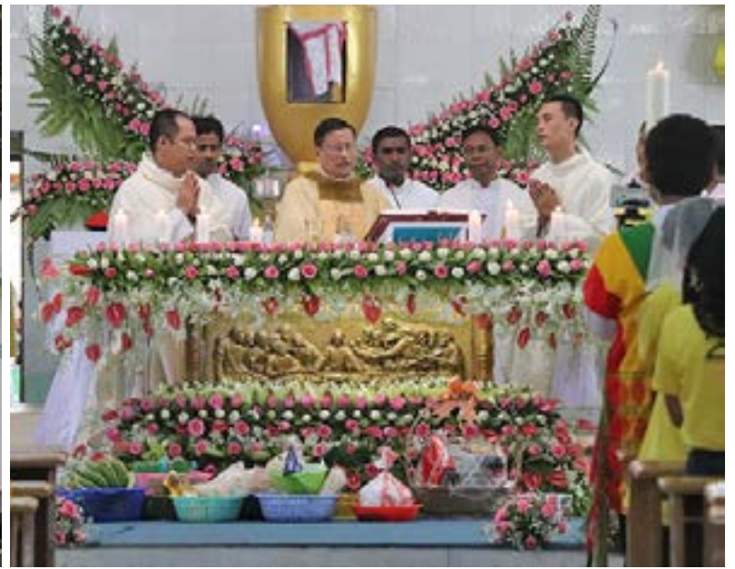
ရန်ကုန်ဂိုဏ်းချုပ်သာသနာ လူငယ်စခန်းချသင်တန်း အမှတ်စဉ် ၂၂ ကို မေလ ၁- ၅ ရက်အထိ တွဲတေးမြို့ ကောင်းကင်ဘုံသို့ပင့်ဆောင်ခြင်းခံရ သောမယ်တော်သခင်မ ဘုရားကျောင်း တွင် ကျင်းပပြုလုပ်ခဲ့ပြီး မေလ ၅ ရက်နေ့တွင် ကာဒီနယ် ချားလ်စ်ဘိုမှ ကျေးဇူးတင်မတ္တူးတရားတော်မြတ်ကို ဦးဆောင် ပူဇော်ပေးခဲ့သည်။