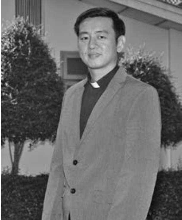
port size အရွယ် ဓါတ်ပုံ (၂) ပုံကိုလည်း ပူးတွဲ တင်ပြရမှာ ဖြစ်ပါတယ်။

တက်ရောက်မယ့် ဘာသာဝင်များအနေနဲ့ အနည်း ဆုံးတော့ တက္ကသိုလ်ဝင်တန်းအောင်မြင်ပြီးသားသူ ဖြစ်ရ မယ် တက္ကသိုလ်က တစ်ခုခု ဘွဲ့ရထားတဲ့သူ ဖြစ်ရမယ်။ ဒါ့ အပြင် အင်္ဂလိပ်စာလည်း အခြေခံသိထားရမှာ ဖြစ်ပါတယ်။ နောက်ထပ်တစ်ခုကတော့ မိမိသာသနာ ကျောင်းထိုင်ဘုန်း တော်ကြီးရဲ့ ထောက်ခံစာ တကယ်လို့ ဘရာသာရ်၊ စွတာရ် ဖြစ်ခဲ့မယ်ဆိုရင် ဝိုင်းအကြီးအကဲရဲ့ ထောက်ခံစာကိုလည်း ပူးတွဲ တင်ပြရမှာဖြစ်ပါတယ်။ တစ်ဆက်တည်းမှာပဲ Pass-