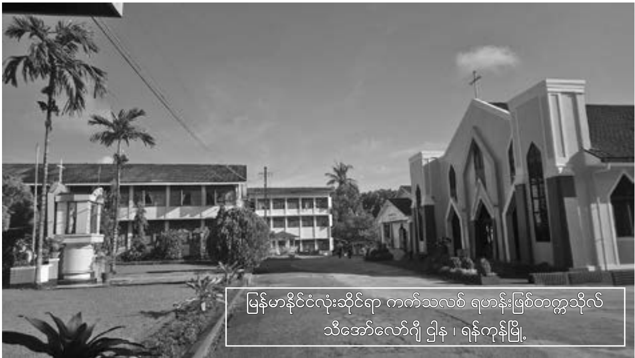
မြန်မာနိုင်ငံလုံးဆိုင်ရာ ကက်သလစ် ရဟန်းဖြစ်တက္ကသိုလ် သီအော်လော်ဂျီ ဌာန ၊ ရန်ကုန်မြို့