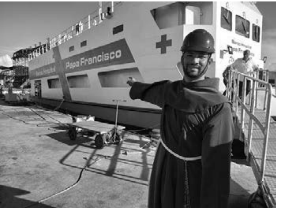
အမြဲစေလွှတ်ပို့ဆောင်ပေးတော်မူသော ဘုရားရှင်၏ အလိုတော်ကို အသွင်ဖော်ဆောင်သော ဆေးရုံသင်္ဘောသဖွယ် ဖြစ်နေသည်။

ဤဆေးရုံသင်္ဘောသည် မည်သူ့ ကိုမှ မခွဲခြား၊ မကန့်သတ်ဘဲ လက်ခံကြည့်ရှုကုသပေးမည့် ကွင်းဆင်းဆေးရုံ (သို့) ရေပေါ်ဆေးရုံ တစ်ခုဖြစ်သည်။ သခင်ခရစ်တော် ရေပေါ်လမ်းလျှောက်ရောက်လာစဉ်က မုန်တိုင်းငြိမ်းသွားပြီး၊ တပည့်တော်ကြီးများ၏ ယုံကြည်ခြင်းကိုခိုင်မာစေခဲ့သည်နည်းတူ၊ ဤဆေးရုံသင်္ဘောကလည်း ရှုတ်ထွေးခြင်းများပြည့်နေသော ဘဝ ပိုင်ရှင်များ၊ ဖြစ်သမျှအပေါ်လက်မိုင်ချ လက်ခံနေသူများအပေါ် ကာယနဲ့ ဝိညာဉ် နှစ်သိမ့်ခြင်း၊ ငြိမ်းအေးခြင်း ကျေးဇူးတော်များ တစ်ပါတည်း ယူဆောင်လာပေးပါစေ စသဖြင့် ရေးသားထားပါသည်။