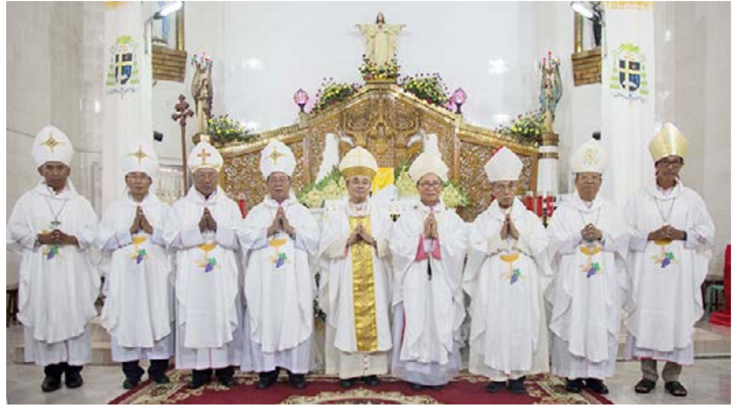
မန္တလေး ဂိုဏ်းချုပ်သာသနာ လက်အောက်ရှိ ဂိုဏ်း အုပ် သာသနာများမှ ဆရာတော်များနှင့်အတူ