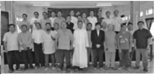
ခြင်း၊ မစ္စားတရားပူဇော်ခြင်း၊ မေတ္တာရွတ်ဆိုခြင်း၊ ကိုယ်တော်မြတ်ဖူးမျှော်ခြင်းတို့ကို ပြုလုပ်ကာ ဝိညာဉ်အားဆေး ယူခဲ့ကြပါသည်။ Pathein OSC