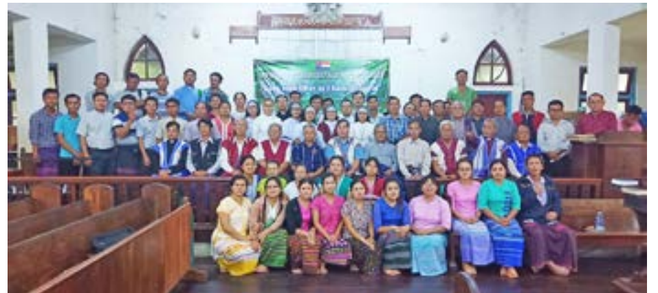
စေရန် အတူတူလက်တွဲပူးပေါင်းဆောင်ရွက်ခြင်းဖြစ်သည်။

ဤမိတ်သဟာရတွေ့ဆုံခြင်းတွင် စုစုပေါင်း (၈၀)ဦး ပါဝင်တက်ရောက်ခဲ့ကြသည်။ Christian Fellowship ၏ ရည်ရွယ်ချက်သည် ခရစ်ယာန်အချင်းချင်းပိုမိုရင်းနှီးကာ ဘာသာရေး၊ လူမှုရေးများတွင် ပါဝင် လုပ်ဆောင်ခြင်းဖြင့် အေးချမ်းသော နေရာဒေသများဖြစ်လာ