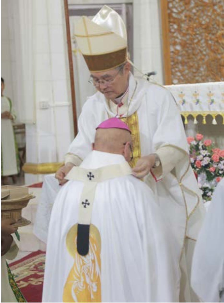
လည်းဖော်ပြနေခြင်းဖြစ်ပါသည်။

ဂိုဏ်းချုပ် ဆရာတော် လည်ဆွဲသည် သံပေတရူး၏ အရိုက်အရာကို ဆက်ခံသည့် ပုပ်ရဟန်းမင်းကြီးနှင့် တစ်လုံးတစ်ဝတည်း တည်ရှိခြင်း အမှတ်လက္ခဏာအဖြစ်