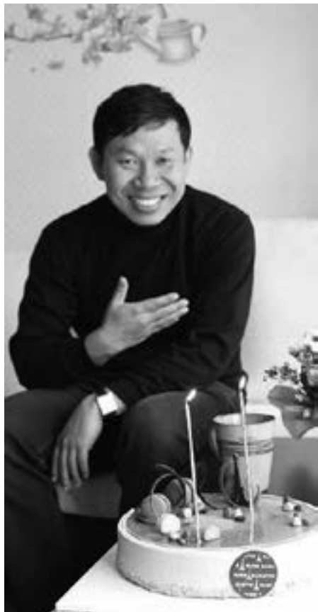
မြန်မာနိုင်ငံကက်သလစ်ဆရာတော်ကြီးများအဖွဲ့ချုပ် - လူထုဆက်သွယ်ရေးရုံး

ကာဒီနယ် ချားလ်စ်ဘို ရန်ကုန်ကက်သလစ်သာသနာပိုင်ဆရာတော်၊ မြန်မာနိုင်ငံ မွန်မြတ်သောအမိမယ်တော် ကောင်းကင်ဘုံသို့ ပင့်ဆောင်ခံရသောပွဲနေ့ ၂၀၁၉ ခုနှစ် ဩဂုတ်လ ၁၅ ရက်နေ့တွင် ထုတ်ပြန်လိုက်သည်