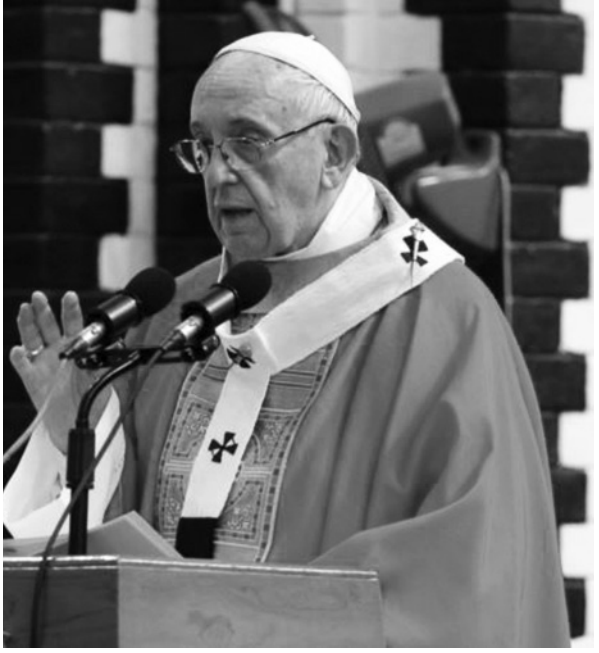
သစ်လွင်ခမ်းနားလှတဲ့ နေရာတွေကို ကျွန်ုပ်တို့ကိုခေါ် ဆောင်သွားဖို့ ကျွန်ုပ်တို့ရှေ့မှာ အမြဲတမ်းရှိနေပါတယ်။

“စေလွှတ်ခြင်းမခံရလျင် သူတို့သည်မည်ကဲ့သို့ ဟောပြောနိုင်မည်နည်း” ဆိုတဲ့မေးခွန်းကတော့ရှင် ပေါလုရဲ့ နောက်ဆုံး မေးခွန်းပဲဖြစ်ပါတယ်။ မွှားတရားတော်မြတ် ပြီးတဲ့အခါမှာ ကျွန်ုပ်တို့လက်ခံရရှိခဲ့တဲ့ ဆုကျေးဇူးတွေကို ခံယူဖို့၊ ထိုဆုကျေးဇူးတော်တွေကို တပါးသူကိုမျှဝေပေးဖို့ ကျွန်ုပ်တို့အားလုံးစေလွှတ်ခြင်း ခံကြရမှာဖြစ်ပါတယ်။ ယေရူး သခင်ကျွန်ုပ်တို့ကို ဘယ်ကိုစေလွှတ်မလဲဆိုတာအမြဲတမ်း မသိနိုင်တဲ့အခါမျိုးမှာ စိတ်ဓါတ်အနည်းငယ် ကျတတ်ပါ တယ်။ ဒါပေမယ့် ဘုရားရှင်ဟာ ကျွန်ုပ်တို့ရဲ့ နံဘေးမှာ ကျွန်ုပ်တို့နဲ့ အတူတူလျှောက်လှမ်းမသွားဘဲနဲ့ ဘယ်တော့မှ ကျွန်ုပ်တို့ကို မစေလွှတ်ပါဘူး။ ဘုရားရှင်ဟာသူ့နိုင်ငံတော်ရဲ့