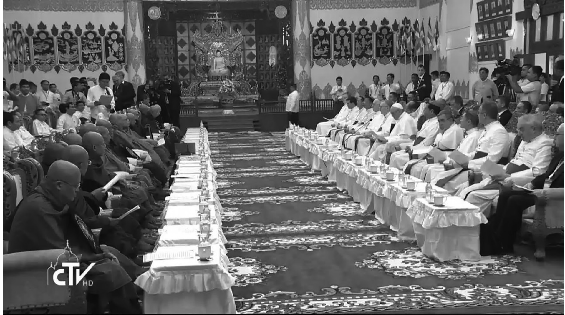
ဗုဒ္ဓတရားဓမ္မများဟာ လူမှုအဖွဲ့အစည်းဘက်စုံ ဖွံ့ဖြိုးတိုးတက်ရေးအတွက် အရေးကြီးသော အဖိုးတန်ရတနာ ဖြစ်ပါတယ်။ ထိုတရားဓမ္မတွေအားဖြင့် အိမ်ထောင်စုစည်းလုံးညီညွတ်ခြင်းမှ သည် ပြည်ထောင်စုစည်းလုံးညီညွတ်ခြင်း၊ ယင်းမှတစ်ဖန် ပို၍ကြီးကျယ်သော ကမ္ဘာ့လူသားစုတွင် ပါဝင်ခြင်းအထိ ဆက်နွယ်မှုများရှိပါတယ်။

ဆရာတော်တို့နဲ့အတူ ယနေ့ ဤနေရာမှာ ဆုံတွေ့ နိုင်ဖို့ဖိတ်ခေါ်ခဲ့တဲ့အတွက်လည်း ကျေးဇူးသဘောတရား တင်ရှိ ပါကြောင်း ထပ်လောင်းလျှောက်ထားလိုပါတယ်။ အားလုံး အပေါ်သို့ ဝမ်းမြောက်ခြင်း၊ ငြိမ်းချမ်းခြင်း ကောင်းချီးမင်္ဂလာ တော်များ သက်ရောက်စေကြောင်း ဆုမွန်ကောင်းတောင်း လိုက်ပါတယ်။