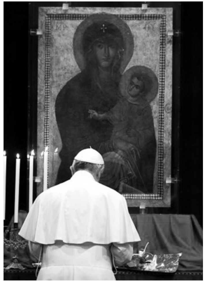
မြန်မာ - ဘင်္ဂလားဒေ့ရှ် ခရီးစဉ်မှ ရောမမြို့၊ ပြန်လည် ရောက်ရှိသည်နှင့် ပုပ်ရန်းမင်းကြီးသည် မယ်တော်အား ကျေးဇူးတင် ဆုတောင်းခြင်း ပြုလုပ်ခဲ့သည်။