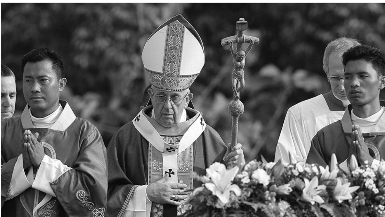
၂၀၁၇ ခုနှစ် နိုဝင်ဘာလ ၂၉ ရက် ကျိုက္ကဆံကွင်းတွင် လူထုနှင့် မစ္စားပူဇော်စဉ် ပုပ်ရန်းမင်းကြီး အသုံးပြုခဲ့သော လက်ဝါးကားတိုင်ပါ တောင်ဝှေးတော်မှာ ကချင်ပြည်နယ်နှင့် ရှမ်းပြည်မြောက်ပိုင်းတို့တွင် စစ်ဘေးဒဏ်ခံနေရသော ကက်သလစ်ဘာသာဝင်များ၏ လက်ဆောင်ဖြစ်သည်။ ကျွန်းသားနှင့်ပြုလုပ်ထားပြီး ပေါ့ပါးသည်။ လက်ဆောင်တစ်ခုတွင် သတင်းစကားများစွာ ပါဝင်ခဲ့သည့်အတွက် လက်ဆောင်ရှင်များ ဝမ်းမြောက်စရာ ဖြစ်ခဲ့ပါသည်။