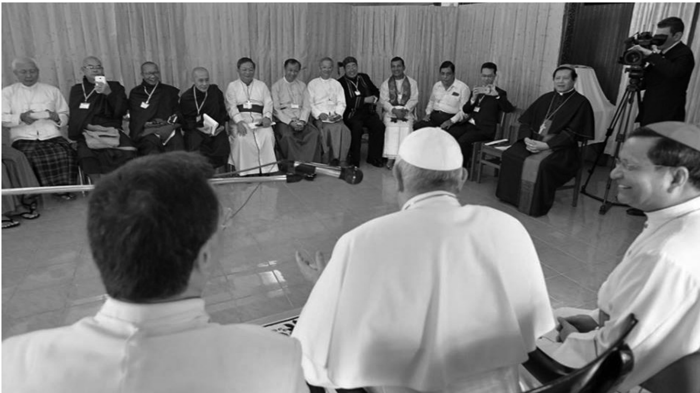
မြန်မာနိုင်ငံခရီးစဉ်အတွင်း ဘာသာပေါင်းစုံမှ ခေါင်းဆောင်များနှင့် တွေ့ဆုံခြင်းကို ရန်ကုန် ဂိုဏ်းချုပ်ဆရာတော်ကြီး ကျောင်းတိုက်တွင် နိုဝင်ဘာ ၂၈ ရက်နေ့က ပြုလုပ်ခဲ့သည်။