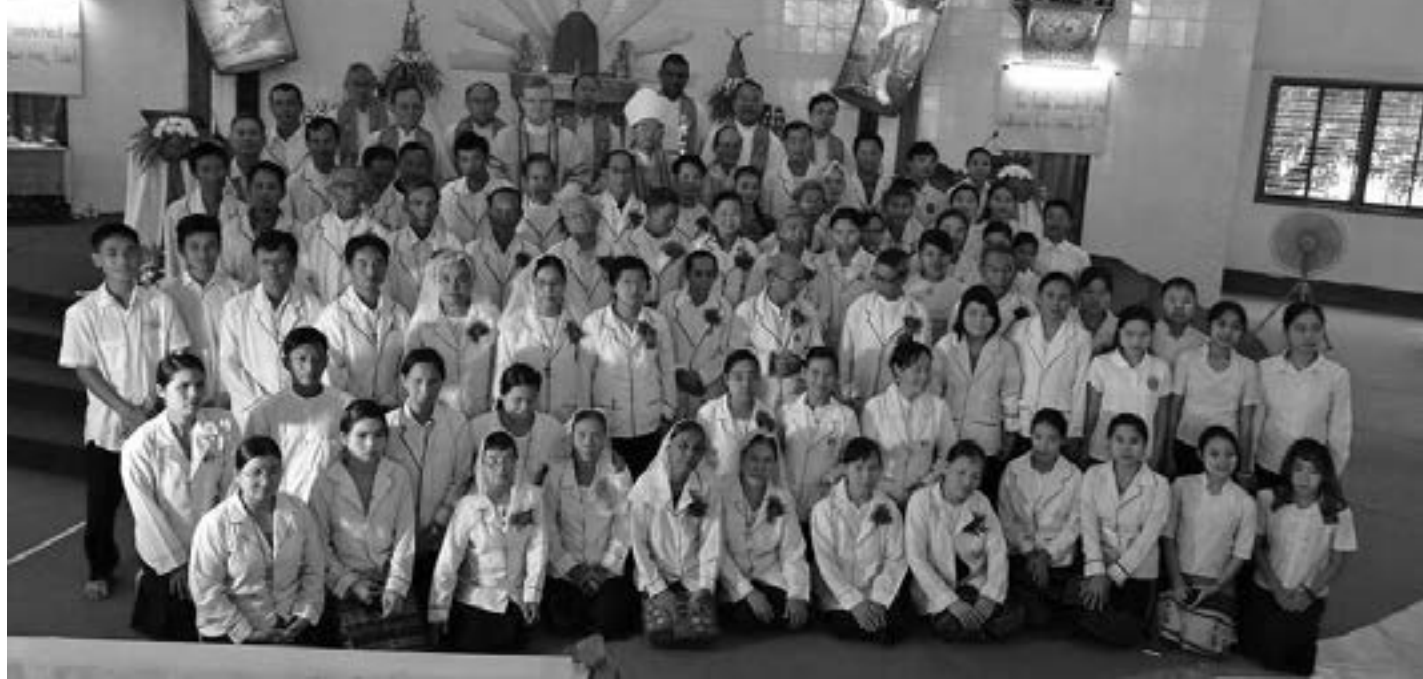
လစဉ် ၂၄ ရက်နေ့တိုင်း ထုတ်ဝေသည်

ပြုမှုခြင်းကို တွေ့ရှိပါက လူမှုဝန်ထမ်းဦးစီးဌာနသို့ အကြောင်းကြားရန် တာဝန်ရှိကြောင်းဝေငှပို့ချ ခဲ့ကြသည်။ ပြစ်မှုဥပဒေများ၊ အပြစ်ဒဏ်များကိုလည်း အချက်အလက် ပြည့်စုံစွာဖြင့် ဝေငှခဲ့သည်။