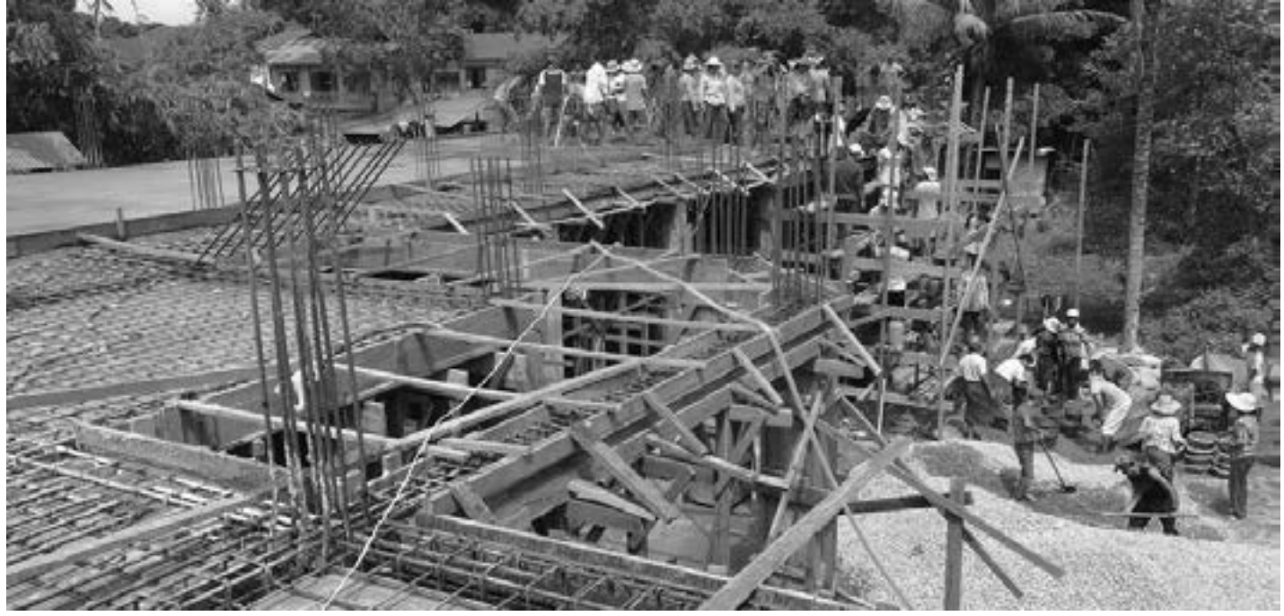
ဗန်းမော်ဘုန်းတော်ကြီးတစ်ပိုင်မှ ဘာသာပေးအဖြစ်ပါဝင်ခဲ့ကြသည်။ မည့်(၂၀၁၈)ခုနှစ် တွင် စတင်ဖွင့်လှစ်နိုင်ရန် တူများ (၁၀၀)ဦး မိုးမောက်မှ(၂၅)ဦးနှင့် ဤကျောင်းဆောင်ကို နှစ်ထပ် မန်စီမှ (၂၅)ဦး စုစုပေါင်း(၁၅၀)ဦးလုပ်အား ဆောင်အဖြစ် တည်ဆောက်မည်ဖြစ်ရာလာ မျော်မှန်းထားလျက်ရှိသည်။ နန်မိုင် (RVA - Banmaw)

၎င်း ရဟန်းဖြစ် သင်ကျောင်းကို လွန်ခဲ့သော( ၃) နှစ်ခန့်မှစတင်ကာ အုတ်မြစ်ချခြင်း ၊ ကွန်ကရစ်တိုင်ထောင်ခြင်းများ ပြုလုပ်ခဲ့သော်လည်း အခြေအနေအမျိုးမျိုး ကြောင့်ရပ်နားခဲ့ရာ ယခုနှစ် နှစ်(၂၀၁၇)ခုနှစ်စက်တင်ဘာလ(၈)ရက်နေ့တွင် တည်ဆောက်မှုလုပ်ငန်း ပြန်လည် စတင်နိုင်ခဲ့ခြင်းဖြစ်သည်။ ထိုနေ့တွင်အဆောက်အဦးပထမထပ်၏ စလပ်လောင်းခြင်းပြုလုပ်ခဲ့ရာ