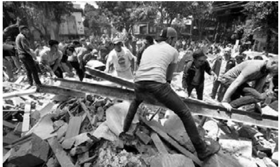
လူပေါင်း ၉၆၀၀ ခန့်သေဆုံးခဲ့သော ၁၉၈၅ ခုနှစ် က ငလျင်ပြီးနောက် အဆိုးဝါးဆုံးသော ငလျင်ဒဏ်ကို ခံစားခဲ့ကြရသည်။

၂၀၁၇ ခုနှစ် စက်တင်ဘာလ ၇ ရက်နေ့၌ မတ္တစီကို နိုင်ငံတွင် ပြင်းအား ၈.၂ ရက်ချိတာစကေး ရှိသော ငလျင် လှုပ်ခဲ့ပြီး ၁၉ ရက်နေ့တွင် ၇ ဒဿမ ၁ ပြင်းအားဖြင့်ထပ်မံ လှုပ်ခဲ့သည်။ စက်တင်ဘာ ၇ ရက်နေ့ ငလျင်ကြောင့် ၁၀၀ ဦးခန့် သေဆုံးခဲ့ပြီး ၁၉ ရက်နေ့တွင် ထပ်မံလှုပ် ခဲ့သော ငလျင်ကြောင့် လူပေါင်း ၂၅၀ ဦးခန့် သေဆုံးသည်ဟု သတင်းများအရ သိရသည်။ ပထမ ငလျင်ကြောင့် ပျက်စီးမှုများအား ပြန်လည် တည်ဆောက်ရန် အမေရိကန် ဒေါ်လာ ၉၀၆ သန်း ကုန်ကျမည် ဟု တွက်ချက်ထားသည်။